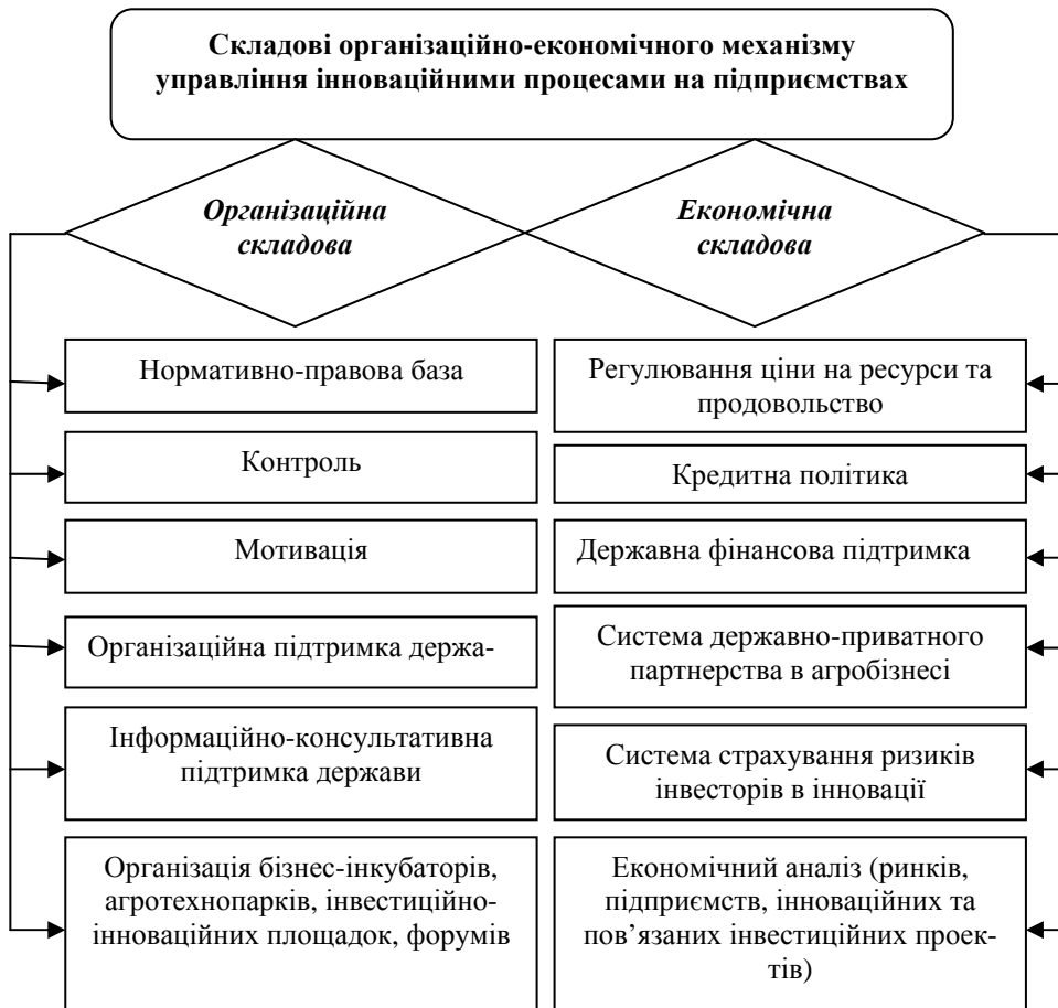
Рисунок 2. Складові організаційно-економічного механізму управління інноваційними процесами підприємств [7].

Тобто, можливість побудови організаційно-економічного механізму функціонального забезпечення інноваційної діяльності створить відповідні умови до: визначення сутності організаційно-економічного механізму управління інноваційною діяльністю підприємств; встановлення переліку принципів його розвитку; формалізації цілей та завдань інноваційної діяльності; розробки процедурних питань з організації порядку висування нових ідей та впровадження нововведень; визначення ефективності інновацій з точки зору їх впливу на зростання прибутку та вартості підприємств в цілому.