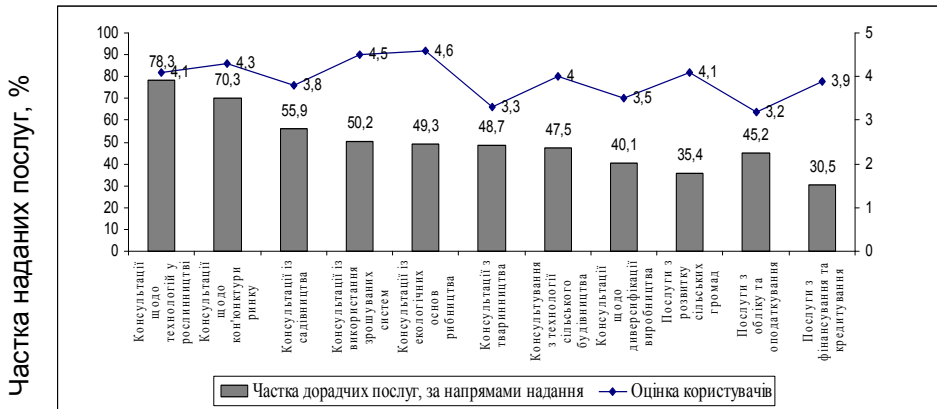
Рис. 1. Види, обсяги та якість дорадчих послуг, наданих товаровиробникам та сільським жителям Херсонської області у 2011р.

Завдяки роботі Херсонської обласної дорадчої служби (рис. 2) значно зростає поінформованість виробників сільськогосподарської продукції, відбулася систематизація інформації по пріоритетності показників, робиться прогноз тенденцій розвитку процесів, суб'єктів та явищ аграрного ринку.