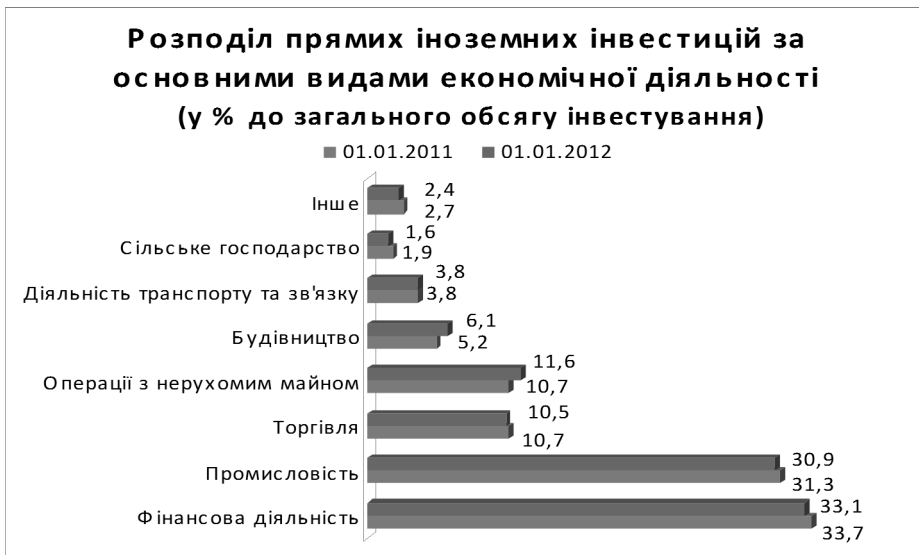
Рисунок 3. Прямі іноземні інвестиції в економіку України

Структура прямих іноземних інвестицій, що спрямовувалися переважно у високоприбуткові сфери та сфери зі швидким обігом капіталу, не сприяла якісному оновленню української економіки. З 2005 р. іноземні інвестори почали надавати пріоритет фінансовій діяльності, операціям із нерухомістю, сфері торгівлі й ремонту. Це є характерним для країн із перехідною економікою, в яких під впливом загальносвітових економічних структурних зрушень відбувається поступове зростання частки невиробничої сфери в економіці, водночас спостерігається і закріплення структурних диспропорцій, які в подальшому стануть одними з каталізаторів фінансово-економічної кризи в Україні.