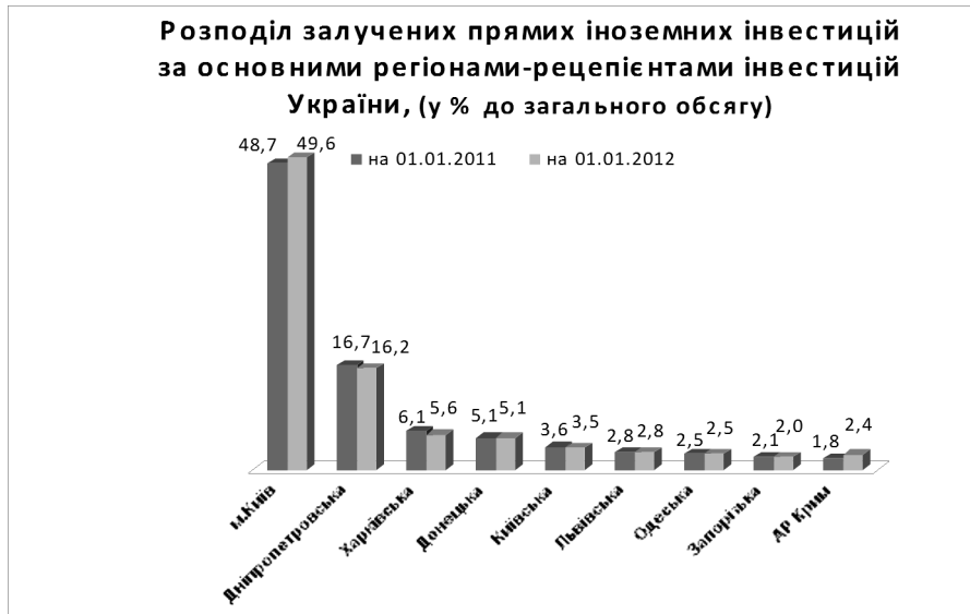
Рисунок 4. Регіональний розподіл іноземних інвестицій в Україні

чизняних банків у цей період не створювали стимулів для розвитку вітчизняної економіки, підтримуючи імпорт, оскільки значна частина кредитних коштів була спрямована на купівлю товарів тривалого використання іноземного виробництва. Спостерігався непропорційний розподіл обсягів залучення інвестицій.