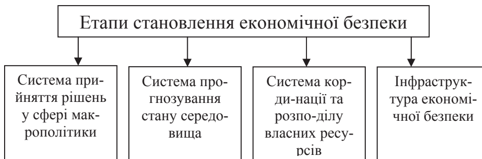
Рисунок 1. Основні етапи економічної безпеки

За своєю природою економічна безпека держави охоплює всі галузі господарства й усі аспекти життя держави та її населення, зокрема, такі напрями для її забезпечення, як безпека вітчизняного сектора виробництва, стійкість національної безпеки й економічна безпека суб'єктів господарювання. Сама економічна безпека має складну внутрішню структуру, в якій можна виділити три її найважливіші елементи: