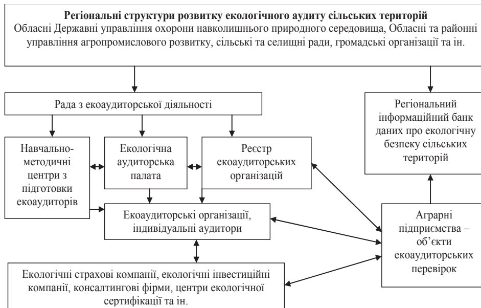
Рисунок 2. Схема організаційної структури системи екологічного аудиту сільських територій

У зв'язку з цим нами пропонується механізм формування регіональної системи екологічного аудиту сільських територій як інституту підвищення екологічної безпеки, зниження екологічних та інвестиційних ризиків, підвищення ефективності використання бюджетних коштів у природоохоронній сфері та інвестиційної привабливості господарюючих суб'єктів в агросфері. Організаційна структура системи екологічного аудиту сільських територій регіону представлена на рис. 2.