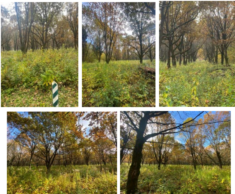
Рис. 1. Ділянка 5 (клонова насіннева плантація дуба звичайного без зрідження)

Результати досліджень. За результатами проведених досліджень на плантації виявлено ранні, ранні проміжні, проміжні пізні проміжні та пізні фенологічні форми дуба. Найбільша частка дерев на ділянці 5 (без зрідження) пізньої фенологічної форми. Частка таких дерев на цій ділянці становила 34,7%. Дещо нижчою є частка пізніх проміжних фенологічних форм – 32,3%. Найнижча частка дерев на ділянці 5 ранньої та ранньої проміжної фенологічних форм, частка яких складала 2,4-4,8%. На ділянці 6 (середнього ступеня зрідження) найбільша частка представлених фенологічних форм дерев – пізня проміжна (39,7%). Частка пізніх та проміжних феноформ становить 21,2-21,7%. Як і на ділянці 5, на ділянці 6 найнижча частка дерев ранньої та ранньої проміжної фенологічних форм – 7,1-10,3%. Схожим є розподіл дерев за фенологічними формам на ділянці 7 (висока інтенсивність зрідження). Зокрема, на ділянці 7 частка пізніх проміжних форм є найвищою та становить 28,2%. Дещо нижчим є представництво пізніх та проміжних фенологічних форм – 22,2-24,8%.