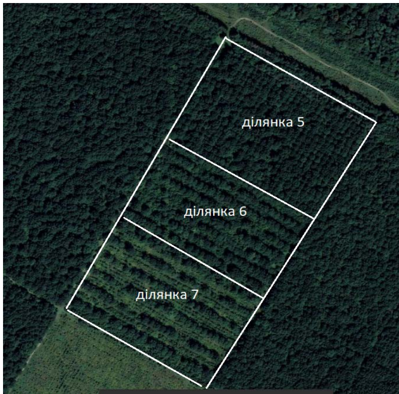
Рис. 4. Загальний вигляд ділянок селекційного комплексу 5, 6, 7 різної інтенсивності зрідження станом на 2025 рік