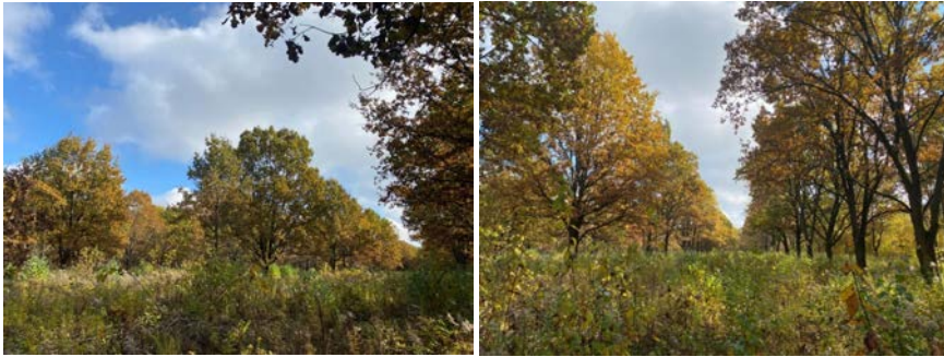
Рис. 2. Ділянка 6 (клонова насіннєві плантації дуба звичайного із середньою інтенсивністю зрідження (видалено через один ряд)

Нами проведено детальні подеревні обліки рівня плодоношення. На ділянках у весняний період проведено обліки дерев для визначення фенологічних форм: рання (Р), рання проміжна (РПр), проміжна (Пр), пізня проміжна (ППр), пізня (П).