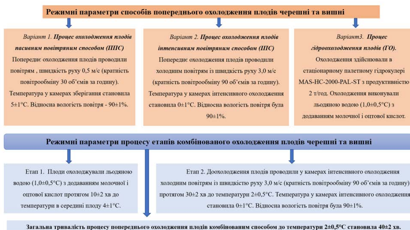
Рис. 1. Способи охолодження плодів черешні та вишні

Основні результати дослідження. Втрата маси плодів (Рис. 2) є ключовим індикатором їхньої лежкості та стабільності якості як після попереднього охолодження, так і під час тривалого зберігання. Цей показник комплексно відображає інтенсивність дихання, транспірації та інших фізико-хімічних змін, що відбуваються у тканинах плодів у процесі тепломасообміну.