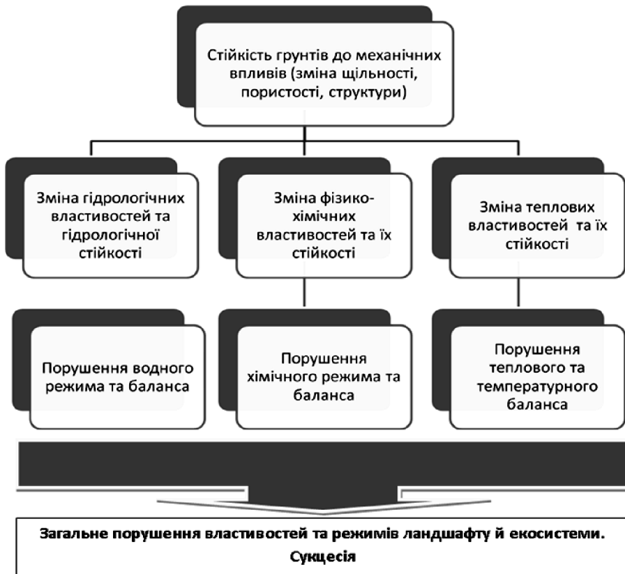
Рисунок 2. Структурна схема негативних чинників впливу на стійкість до механічного впливу на функціонування екосистеми зрошуваного землеробства

В процесі роботи техніки на сільськогосподарських угіддях створюється значна строкатість фільтраційних, водних, теплових та інших властивостей ґрунтів, що призводить до зменшення вмісту гумусу й органічних речовин, а значить – до зниження родючості ґрунтів. Причому такий негативний прояв практично неможливо компенсувати агротехнічними або агрохімічними заходами (обробіток ґрунту, внесенням органічних і мінеральних добрив, застосування нових сівозмін тощо). Слід підкреслити, що надмірне антропогенне навантаження на поверхневі прошарки ґрунту можна послабити їх розпушуванням, проте надмірне напруження в нижніх горизонтах зрошуваних ґрунтів призводить до їх переущільнення, зокрема, до формування, так званої «плужної підшви».