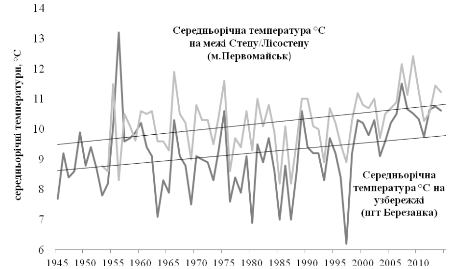
Рисунок 4. Багаторічна динаміка середньорічних температур (°C) на території Північно-Західного Причорномор'я

Лісостепом. Для південної частини степової зони навпаки, явного вираження з початку 80-х років набула тенденція до поступового зменшення опадів, які за півсторіччя зменшились на 30-50 мм.