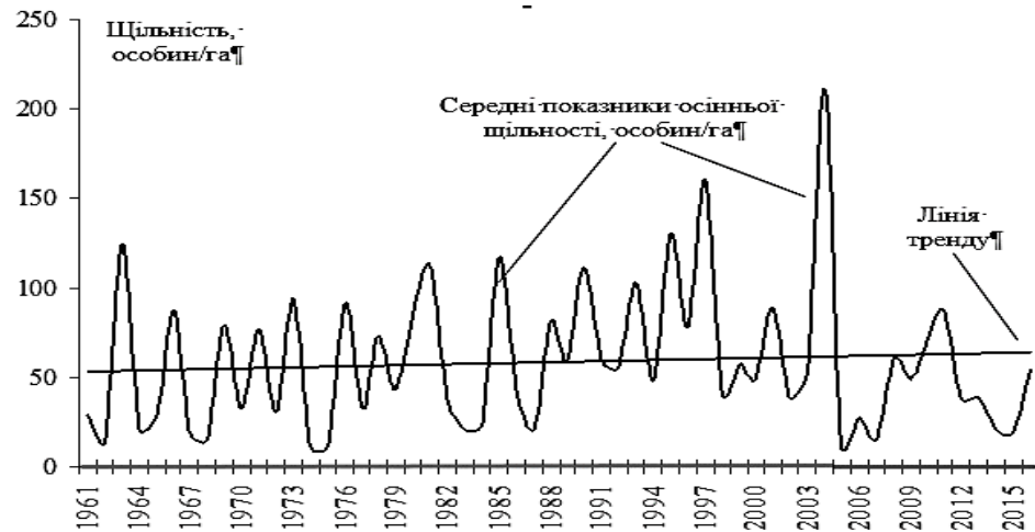
Рисунок 5. Багаторічна динаміка усереднених показників осінньої щільності гризунів (особин/га) на території степових районів Миколаївської області за 1961-2015 рр.

Приклад реалізації такого типу явищ для південних і центральних районів Миколаївської області в період 1961-2015 рр. відображені на графіку рисунку 1, який впродовж 1961-2005 рр. демонстрований відносно рівномірною амплітудою коливань із досить стабільним характером чотирирічних циклів [6].