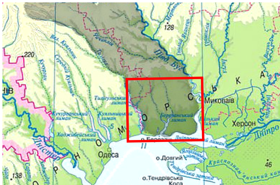
Рисунок 1. Зона досліджень в межах аридно-степової смуги Тилігуло-Бузького межиріччя

Матеріал і методи дослідження. Базисним матеріалом для аналітичних узагальнень даної роботи, є результати власних еколого-ботанічних, агроєкологічних, біокліматичних і біоценотичних досліджень існуючих екокомплексів різних ділянок сухо-степової смуги Тилігуло-Бузького межиріччя, виконаних впродовж 1994-2016 рр. (Рис.1).