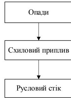
Рис. 1. Схема формування поверхневого стоку

Розглядається операторна послідовність процесів формування паводків і водопіль «схильний приплив – русловий стік», представлена на рис. 1.